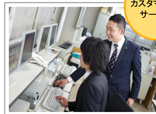
カスタマーサービス課